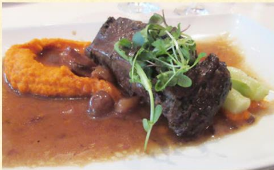
Macreuse de boeuf braisée, bok choy, purée de courge

Inventaire: au 3 avril 2019, dans 80 succursales du réseau.